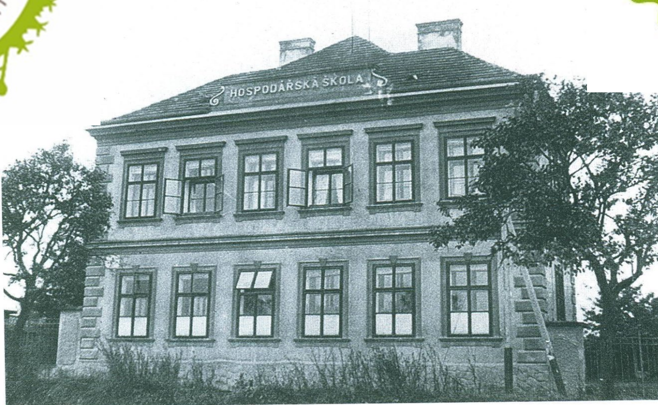
Původní budova školy